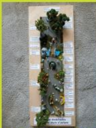
Elèves de l'école de Grund und Hauptschule de Rust Allemagne