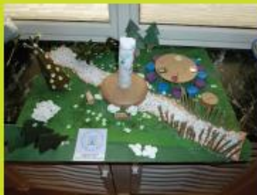
Eclaireuses et Eclaireurs Israélites de Strasbourg