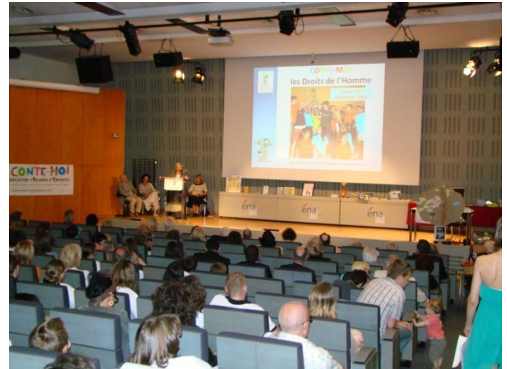
Remise des prix à l'ENA - Strasbourg

Ce concours ouvert aux jeunes et aux moins jeunes, permettait aussi un échange intergénérationnel.